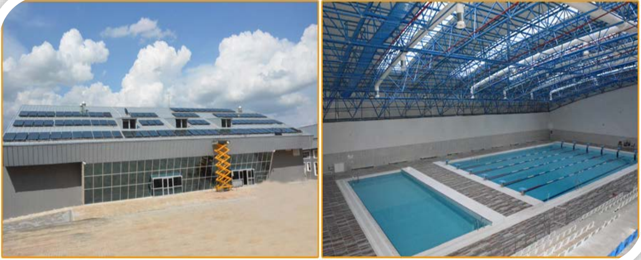
Kapalı Yüzme Havuzu İnşaatı