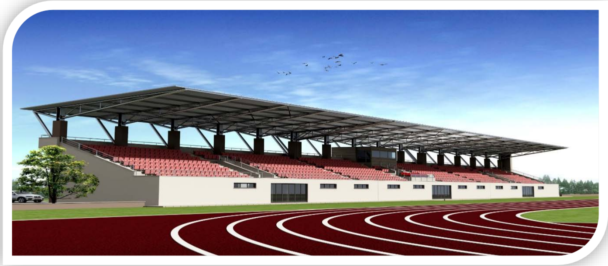
1000 Seyircili Tribün Projesi