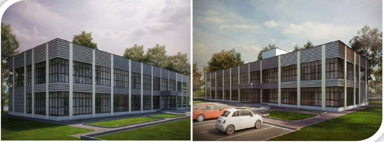
Deney Hayvanları Araştırma ve Üretim Merkezi Binası Projesi

İşlerinin Mühendislik proje hizmet alımları gerçekleştirilmiştir.