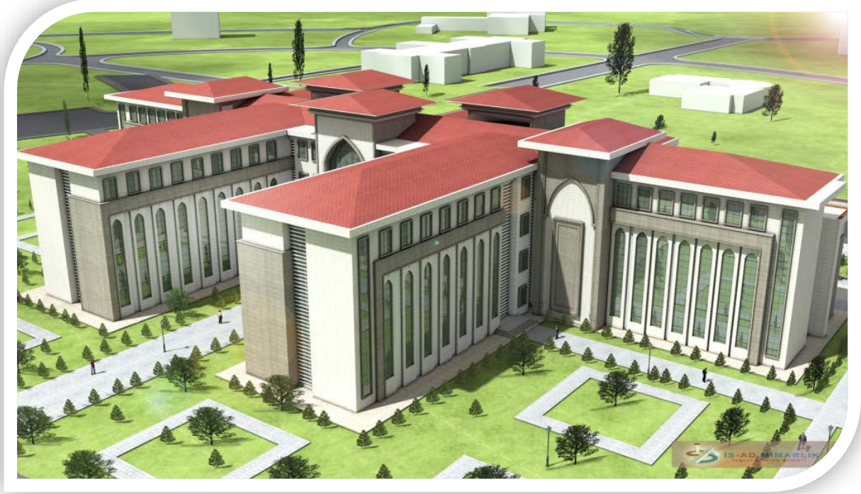
İslami ilimler Fakültesi Projesi