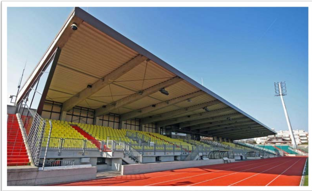
Atletizm Pistli Stadyum