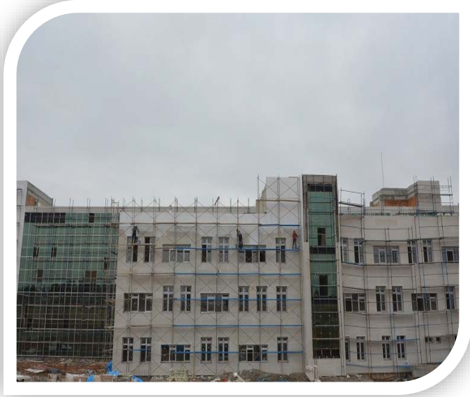
Eğitim Fakültesi Ek Bina İnşaatı