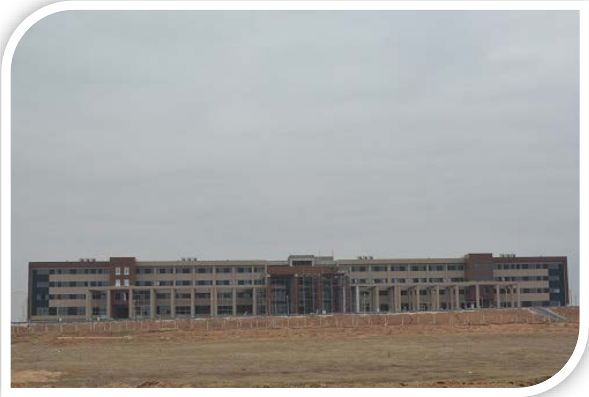
Mühendislik Fakültesi Binası İnşaatı

Bu proje kapsamında yapılan işlerden; Mühendislik Fakültesi Binası, Teknik Bilimler M.Y. O Binası ve Eğitim Fakültesi Ek Binasının inşaat çalışmaları devam etmektedir.