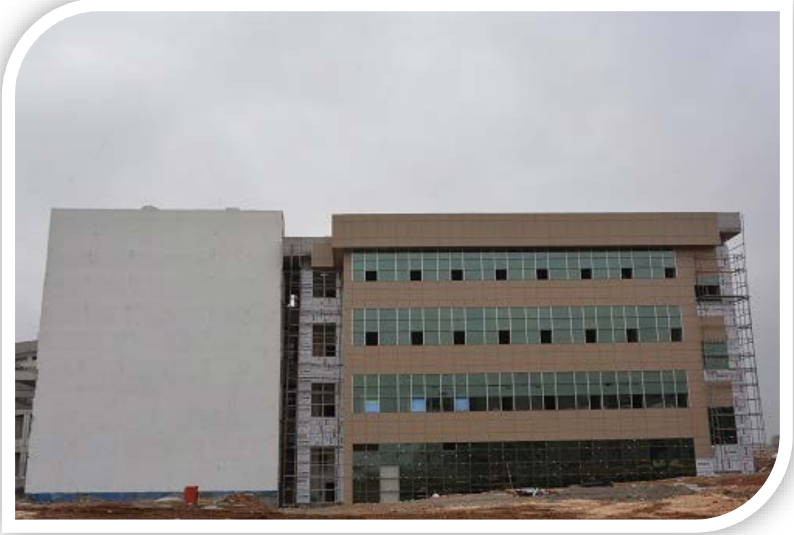
Teknik Bilimler M.Y. O 1. Etap İnşaatı